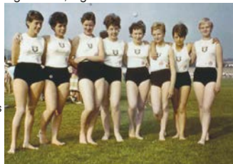
(Auf dem Foto fehlend: Inge Bach)