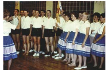
"Sing-Tanz-Training" für den Gruppenwettkampf in der Turnhalle Halteyer Straße