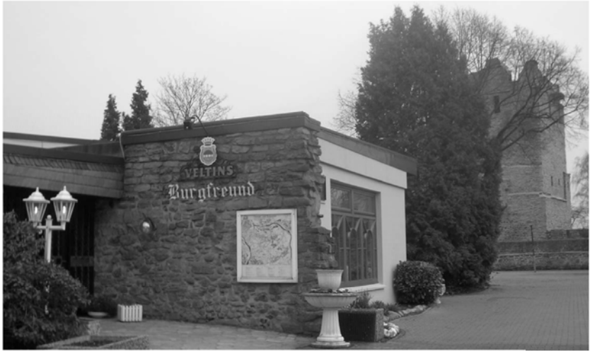
Café – Restaurant “ Burgfreund “ Burgstraße 2, 45289 Essen (Burgaltendorf) Tel. : 0201 / 578935