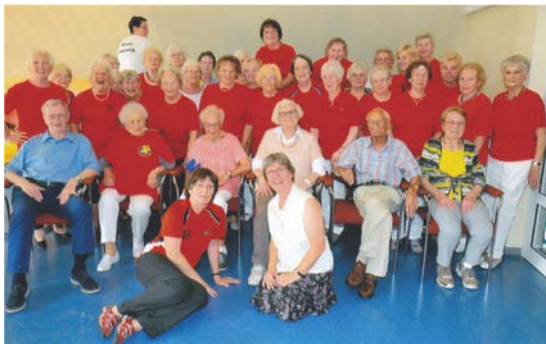
Zur Erinnerung an die Mädels der Donnerstag-Gruppe

Jetzt wünschen wir dir viel Spaß und Freude an diesem Tag, auch in der Zeit, die noch kommen mag. Wir sind alle sehr traurig und wünschen dir viel Glück, Gesundheit und mit Gottes Segen noch ein beschwerdefreies Leben.