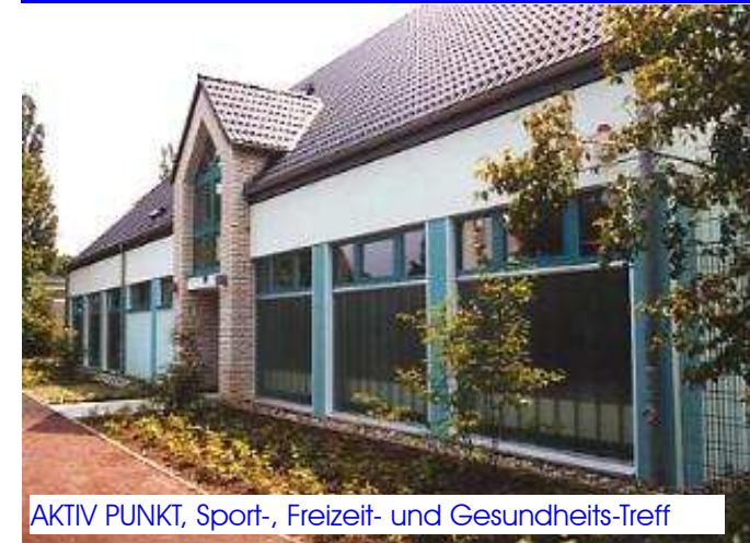
AKTIV PUNKT, Sport-, Freizeit- und Gesundheits-Treff